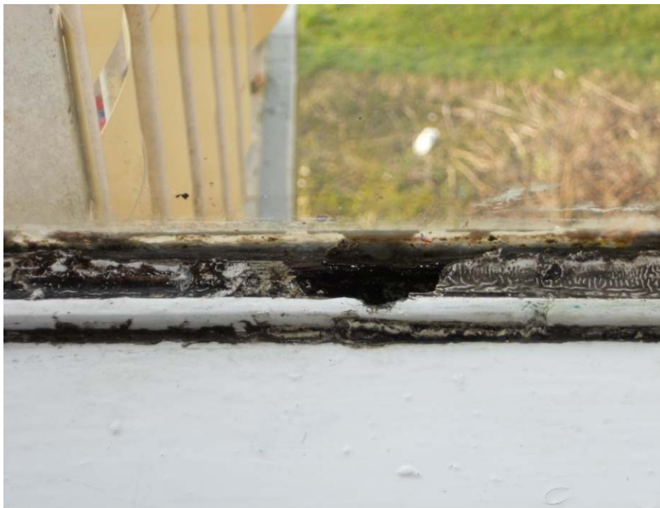
Kozijn van een woning aan de Jan Voermanstraat.

Vochtvreter mochten niet baten, ze liepen vol met water maar het was dweilen met de kraan open. Zonde van mijn €35 want ik kon ze weggooien.