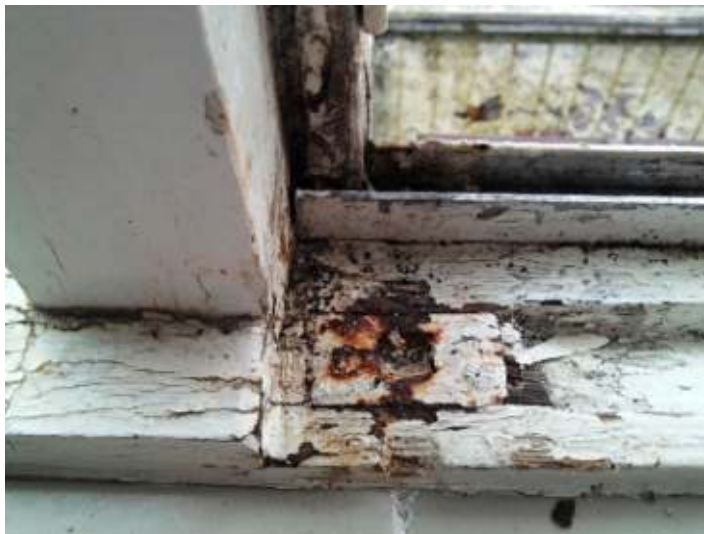
Kozijn van een woning aan de Jan Evertsenstraat.

Op het onlangs gestarte meldpunt achterstallig woningonderhoud regende het klachten. De Knijtijkzerpanden, omsloten door de Jan Evertsenstraat, Jan Tooropstraat en Jan Voermanstraat, staan op de nominatie gesloopt te worden om plaats te maken voor koopwoningen, Voorlopig zijn de sloopplannen van de baan maar het is onduidelijk wat de nu met de woningen gaat gebeuren. Het resultaat is dat woningcorporatie Far West al geruime tijd geen onderhoud meer uitvoert. Hierdoor verslechteren de woningen in hoog tempo, waar de bewoners onder lijden. De SP vond het daarom tijd om poolshoogte te nemen.