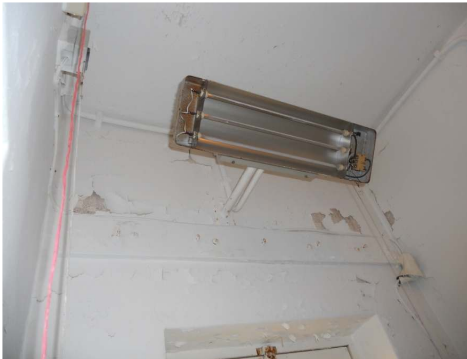
Badkamer in de Jan Voermanstraat.

Wellicht kunt u mij hier iets meer over vertellen. Zelf heb ik nog geen besluit genomen, maar met dit rondschrijven van de SP leek het mij een goede reden om u te schrijven, en alsnog maar weer eens te onderstrepen hoe de situatie hier is. Vandaag, zaterdag 5 februari, zitten wij al drie dagen zonder lift. Voor ondergetekende betekent dat 12 trappen op en af. (hoewel ik diabetespatiënt, nierpatiënt ben en een immuunziekte heb, lukt dit me nog wel, hoewel het niet bepaald prettig is, vooral niet bij bezoek.)